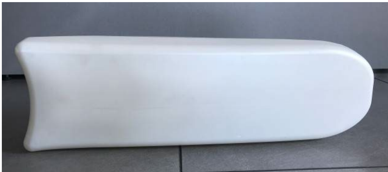
Photo vue de côté de la carrosserie latérale / Photo of the side of the bodywork

Signature et tampon de l'ASN / Signature and stamp of the ASN