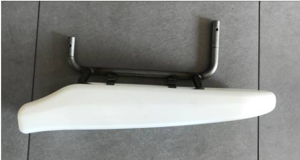
Photo vue de devant avec supports / Photo from the front with supports